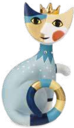
Max il re

13 cm 25.002950.0.575.4 · VE1 31-401-14-1