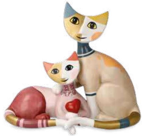
Vivien e Peppie

16 x 14 cm 25.003950.0.575.4 · VE1 31-401-16-1