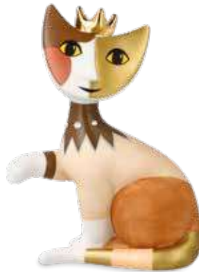
Gina la principessa

12 cm 25.002950.0.575.4 · VE1 31-401-15-1