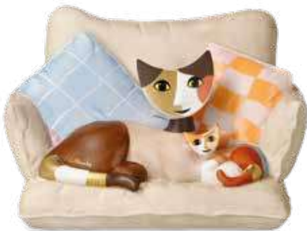
La Mamma e Minni

17 x 10 cm 25.003450.0.575.4 · VE1 31-401-09-1