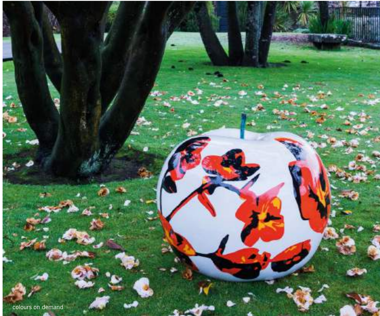
colours on demand